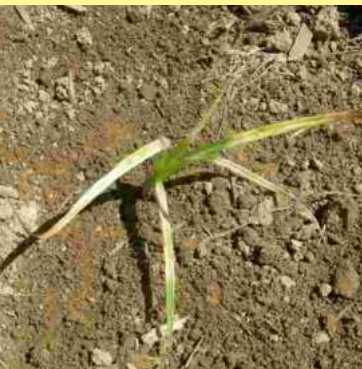
Efecto de Juncia tratada