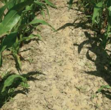
Aplicación en post-emergencia